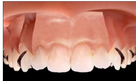
Regelversorgung: Partielle Modellguss Prothese mit 4 zweiarmigen Klammern (Halteelementen) an 25, 26 und 13 und 14 zum Ersatz der fehlenden Zähne 24, 22, 21, 11 und 12.