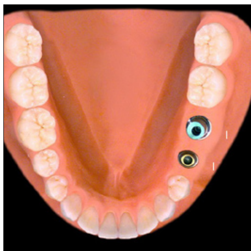
Zwei Implantate zum Ersatz der Zähne 35 und 36. Versorgung der zwei Implantate mit jeweils einer Vollkeramikkrone (Jacketkrone)