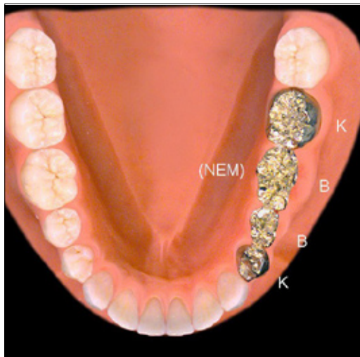
Unverblendete Brücke aus einer mundbeständigen Nichtedelmetall-Legierung. Überkronung der Zähne 34 und 37 als Brückenpfeiler mit Ersatz der Zähne 35 und 36 als Brückenglieder.